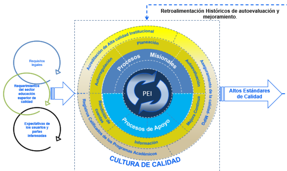
Figura 1. Sistema integrado de Aseguramiento de la Calidad de la Institución Universitaria Escuela Nacional del Deporte.